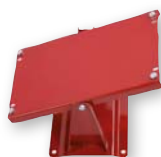
Mod. 9768 Mod. 9769