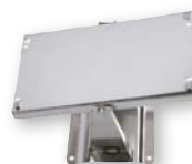
Mod. 9764 Mod. 9765