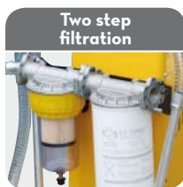
Two step filtration